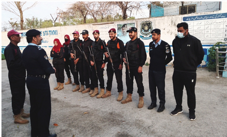
Search and combing operation conducted at Secretariat Police Station jurisdiction