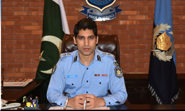
Citizens should cooperate with police to ensure peace and tranquility; CPO/ DIG Operations