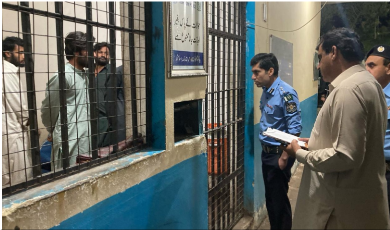
CPO/DIG Operations pays surprise visit to CIA, Investigation Wing and Khanna Police Station; reviewed the performance of CIA and investigation wing and checked the records, roznamcha, front desk, lockup etc.