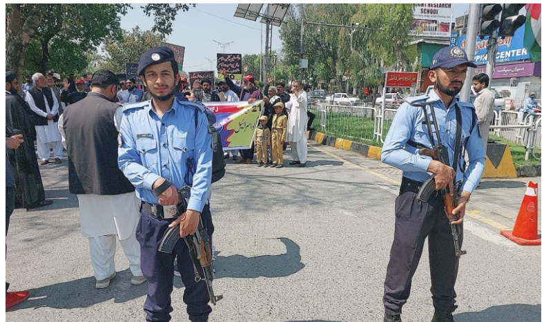
اسلام آباد کیمپینل پولیس کے دفاتی دار حکومت میں جمعہ الوداع اور یوم القدس کے جلوس کے سلسلہ میں موٹر سیکوریٹی انتظامات