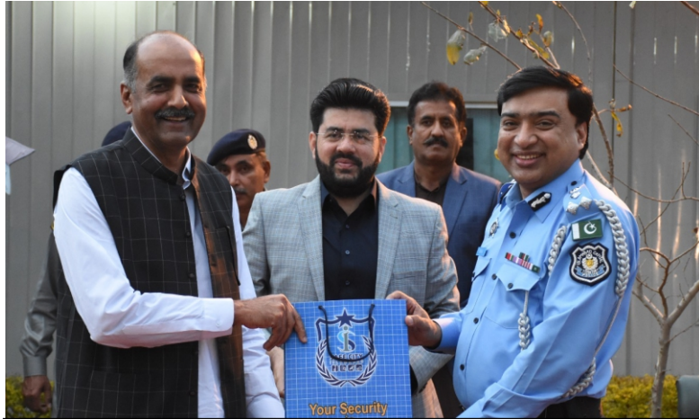
ایس پی چوہدری حامد حسین کے اعزاز میں ٹریٹنگ ہیڈ کوارٹریٹ فیض آباد میں الوداعی تقریب