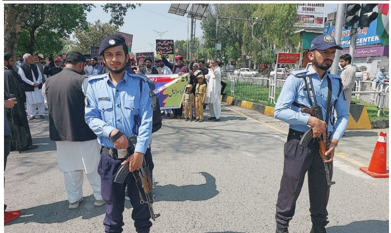
2500 policemen deployed for smooth observance of Jumat-ul-Wida, Youmul Quds