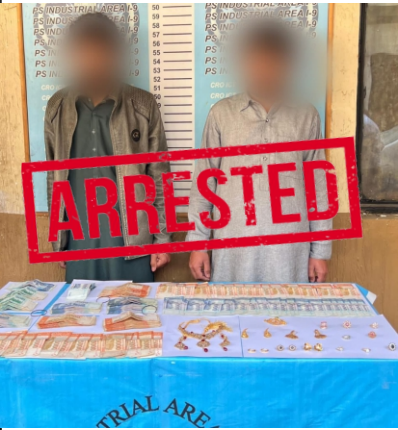
ایپ "15- پر فوری اطلاع کریں۔

گرفتار ملزمان کے قبضے سے لاکھوں روپے مالیت کے طلائی زیورات اور مسروقہ نقدی برآمد کر لی گئی، ملزمان کیخلاف مقدمات درج، مزید تفتیش جاری ہے