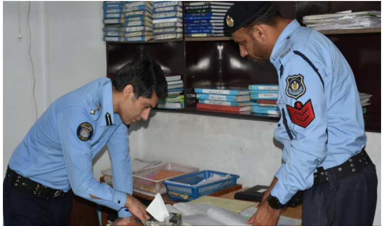
سی پی او ڈی آئی جی آپریشنز کا تھانہ بنی گالہ کا دورہ، ناقص کارکردگی پر افسر مہتمم تھانہ بنی گالہ کو معطل کر دیا