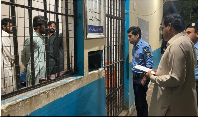
ڈی آئی جی آپریشنز کا سی آئی اے، انوسٹی گیشن ونگ اور تھانہ کھنڈہ کا دورہ کیا، کارگردگی کا جائزہ لیا، روزنامی، فرنٹ ڈیسک، ریکارڈ روم، حوالات وغیرہ کا معائنہ کیا