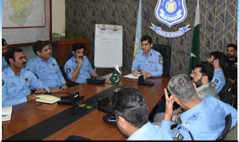
CPO/ DIG Operations Islamabad chaired an important meeting regarding crime prevention